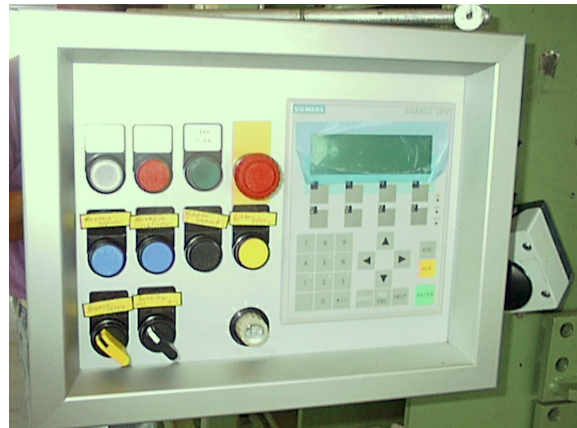
Bedientableau mit OP