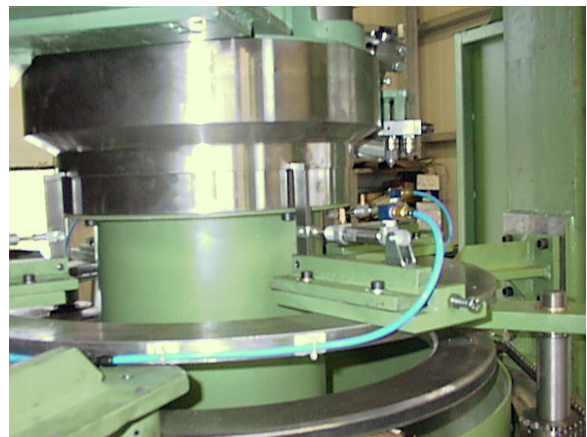
Wickelscheibe mit Drahtandrückfinger