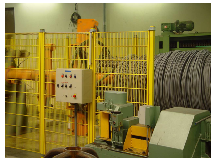
Разматыватель с пультом управления и острильной валковой машиной