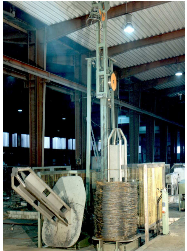
Две платформы, поворачивающиеся с помощью гидравлики

Подача осуществляется по принципу вертикального направления движения проволоки. Передвижной верхний поворотный ролик опускается вниз для укладки катанки. Процесс может осуществляться гидравлически или через цепную тягу. Встроенный петлеуловитель способствует остановке подключенной машины. Размещение двух, поворачиваемых с помощью гидравлики, платформ перед стойкой обеспечивает непрерывную загрузку бунтов катанки с помощью вилочного погрузчика без остановки устройства.